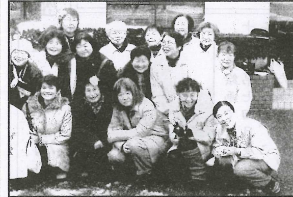
自然休前で記念撮影

阿東女性林業研究会は、育林技術や森林経営技術の向上を目的に1981年に設立されました。現在、会員は14名で、こけ玉など身近にある森林資源を活用した商品作りに取り組み、道の駅まつりや物産フェアなどのイベントで販売や体験指導などを行っています。