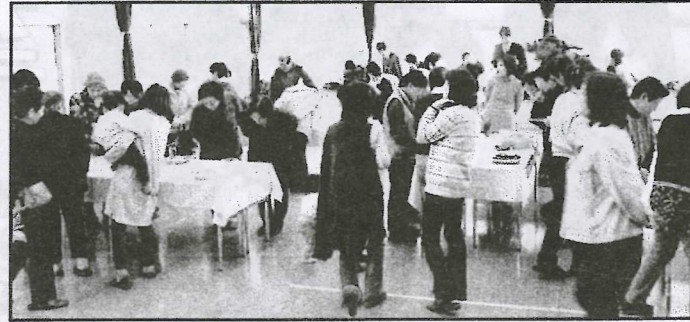
多く(写真右)にぎわ 会場の人で