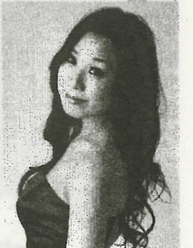
赤川優子〔ソプラノ〕