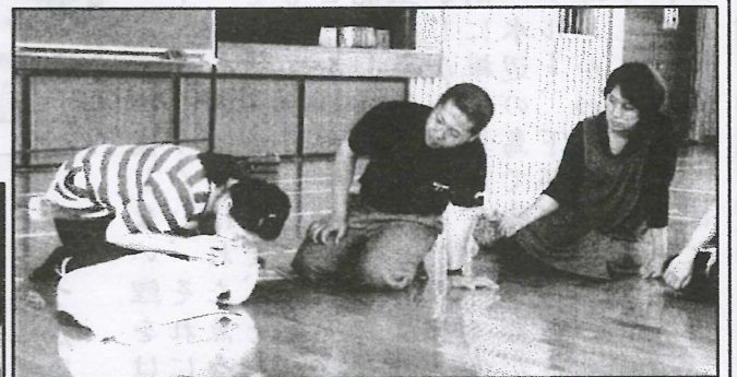
人形を使って人工呼吸の練習をする保護者

AED(自動体外式除細動器) 電気ショックにより、停止した心臓を蘇らせることを試みる。公共施設を中心に備えられている。