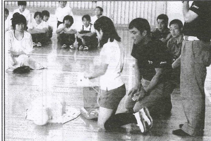
みんなの前でAEDの訓練をする5年生

水泳シーズンを前に、さくら小で救急救命講習会が6月19日(火)に開かれました。保護者や地域の方のほか、今年は5・6年生も参加し、阿東消防署のお話に熱心に聞き入っていました。