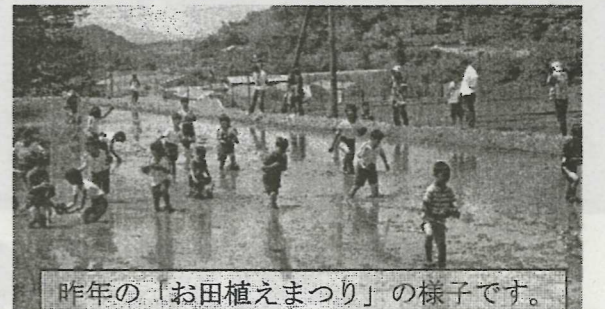
昨年の「お田植えまつり」の様子です。

徳佐はやしだ保存会・山口県央商工会青年部 主催による、お田植えまつりが5月20日(日) に願成就温泉前の田んぼで開催されます。 当日は徳佐小学校5・6年生による「はやし だ」の披露やお田植え体験、どろんこフラグ やどろんこ尻相撲を行います。 どろんこフラグ・どろんこ尻相撲の申込 は、山口県央商工会阿東支所 (Tel.083-956-0032) まで。