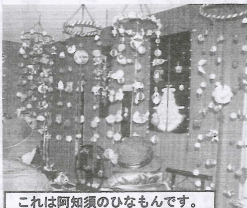
これは阿知須のひなもんです。

「この冬も 楽しかったね〜！」 「冬女性学級」閉講 1月12日から始まった「冬女性学級」も3月15日を最後に終了しました。 今年は初めてのひなもん作りにも取り組みました。2月10日は学級の日帰り旅行で「ひなもん祭り」(阿知須)見物にも行き、実物の作品を見て作り方の研究もしました。その結果、4組の立派なひなもんが完成しました。嘉年分館の図書コーナーに約1か月間展示して、御来館の皆様にも見ていただきました。