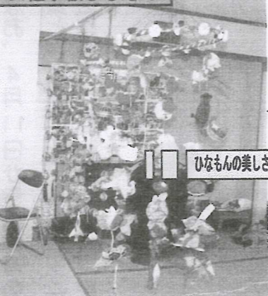
ひなもんの美しさも楽しんでいました。

でしたが、学級生たちは毎週1回の開講を楽しみに、暖かくて賑やかな冬を過ごされたようです。 また、女性の中に1人だけ男性がいて、なれないうち作業に取り組んで