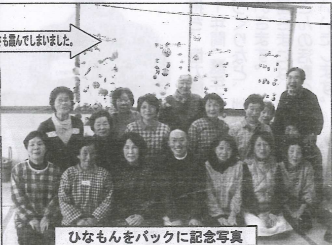
ひなもんをパックに記念写真

でしたが、学級生たちは毎週1回の開講を楽しみに、暖かくて賑やかな冬を過ごされたようです。 また、女性の中に1人だけ男性がいて、なれないうち作業に取り組んで