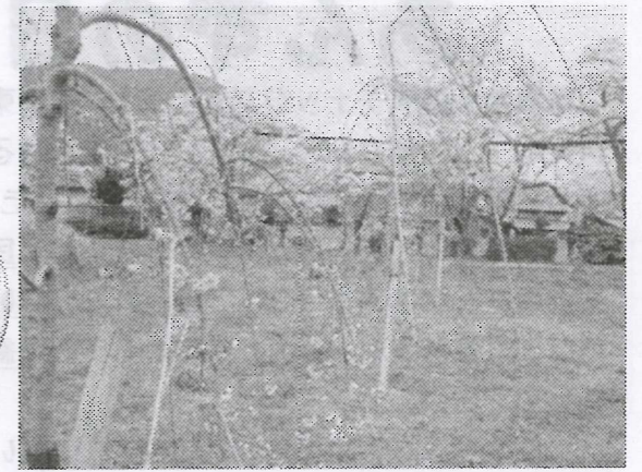
桜の園 (生雲八幡宮参道横)