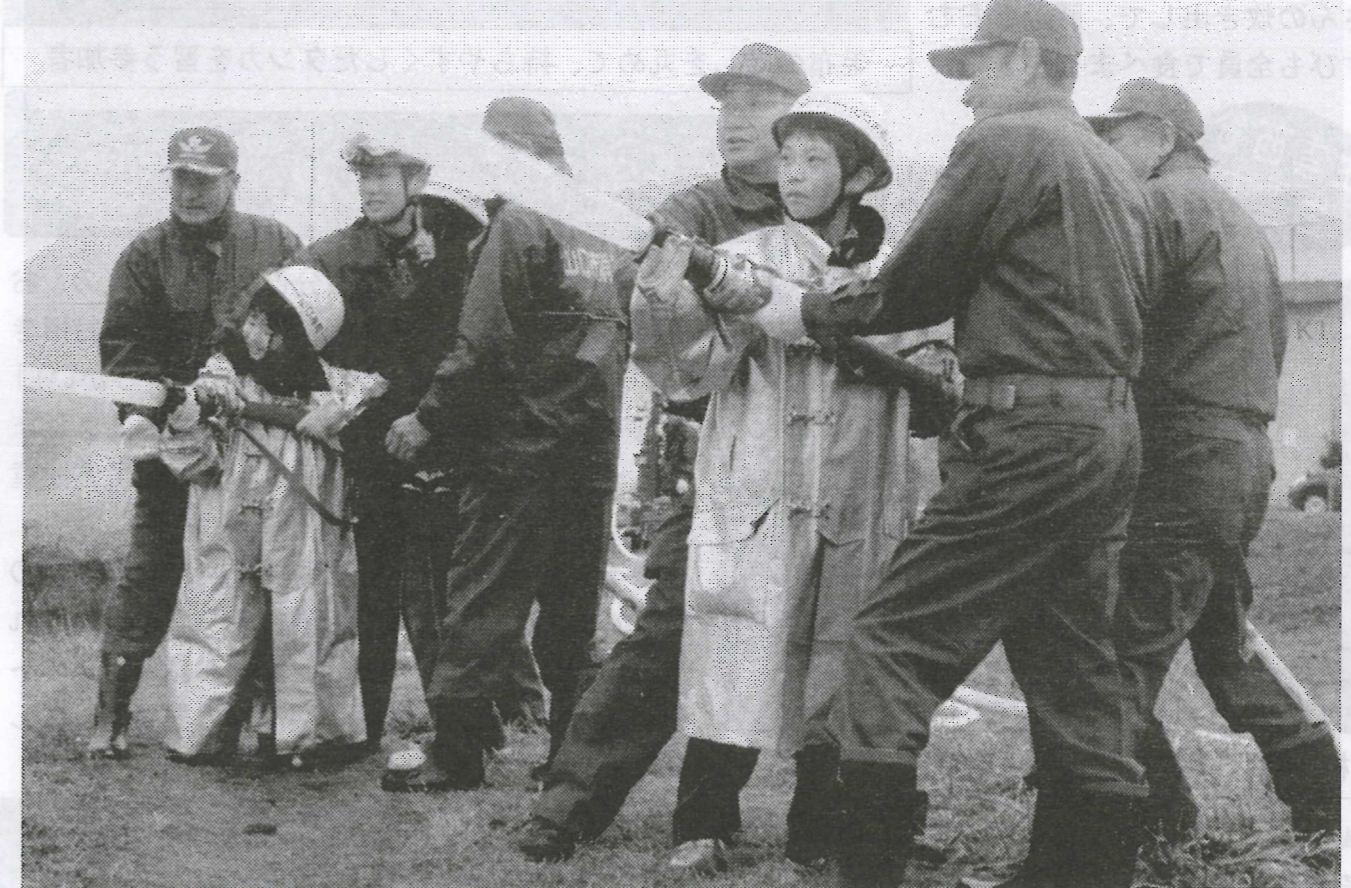
地元消防団員や消防署員に支えられ、放水を体験する生雲小児童。