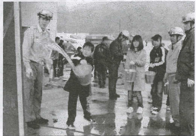
火元に向けてバケツで水をかける小中学生

生雲分館では、消防署員の指導で、避難訓練やケガの応急処置法を、農協の低温倉庫前では、消火器やバケツを使つての消火などを習いました。また、旧阿東土木横の生雲川では、実際に消防車での放水を体験しました。(2面に続く)