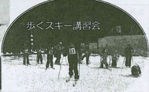
歩くスキー講習会