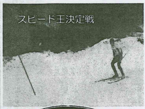
スピード王決定戦