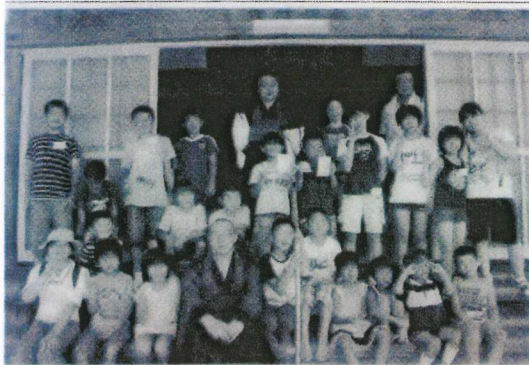
「親子で学ぼう寺子屋・高原鉄道」の参加者ら

泉福寺で児童ら宿泊体験 阿東 座禅やミニSL乗車楽しむ 山口市阿東徳佐中の泉福 28日から29日の1泊2日の 寺(佐藤衛道住職)で7月1日登って本堂に宿泊するイベ