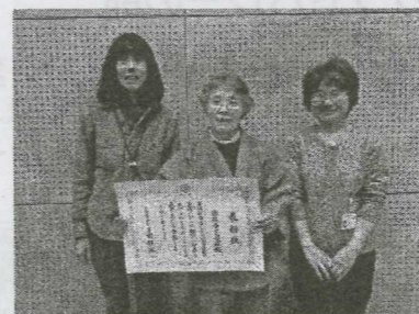
阿東図書館の職員とともに記念撮影